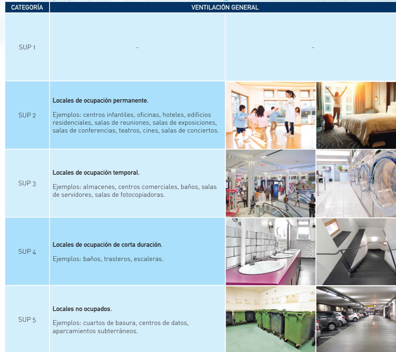
Tabla 4: Ventilación general — ejemplos ilustrativos de aplicaciones correspondientes a las categorías SUP

En la tabla 4 se muestran ejemplos de aplicaciones típicas correspondientes a las respectivas categorías de SUP: