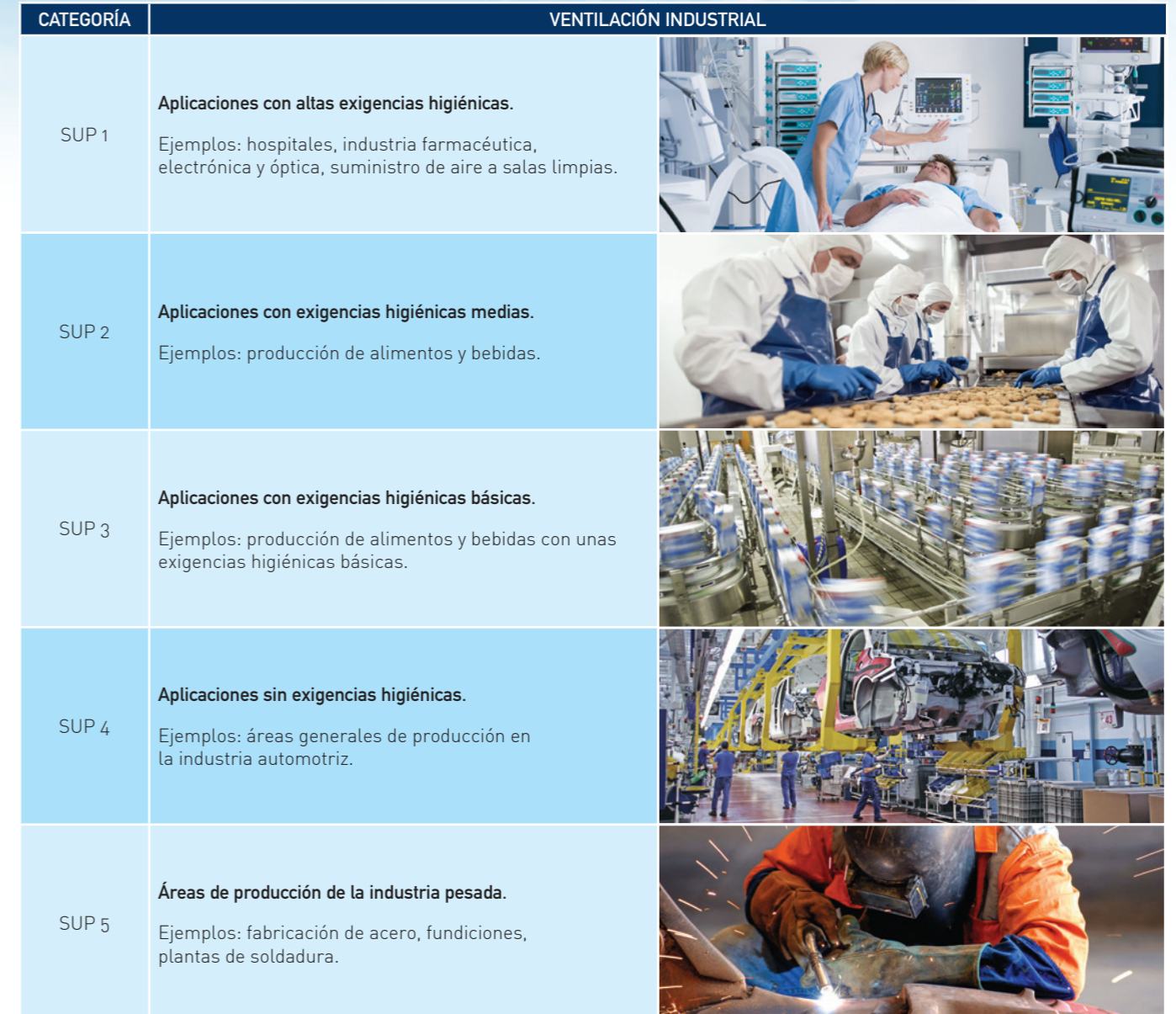
Tabla 4: Ventilación industrial — ejemplos ilustrativos de aplicaciones correspondientes a las categorías SUP