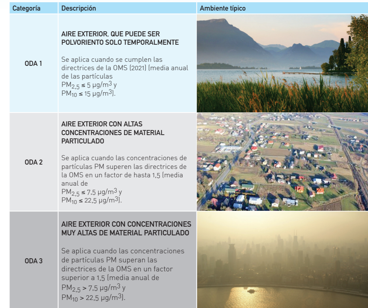
Tabla 1: Categorías de aire exterior